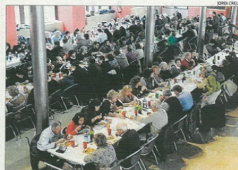
L'arrossada popular es va celebrar a Cal Sitges