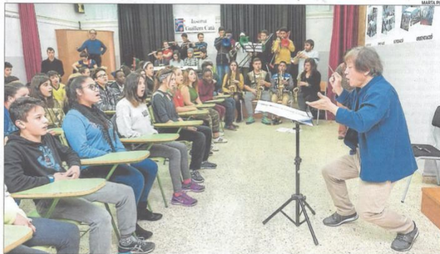
Kazushi Ono es va mostrar molt efusiu en l'assaig que va fer ahir al matí amb els cantants i músics de l'Institut Guillem Catà

L'aventura va començar a l'octubre, un cop ja s'havia confirmat que el projecte de la big band del centre manresà havia estat escollit per l'Auditori. Des d'aleshores, els joves estudiants han estat assaïant Il·lus Esperança , que dura un quart d'hora, amb la mirada fixada en